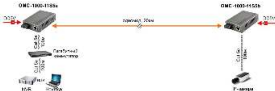
Рис. 4 Схема подключения медиаконвертеров OMC-1000-11S5a и OMC-1000-11S5b