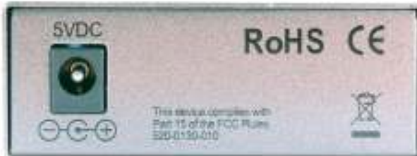
Рис.2 Вид сзади медиаконвертеров OMC-1000-11S5a (OMC-1000-11S5b)