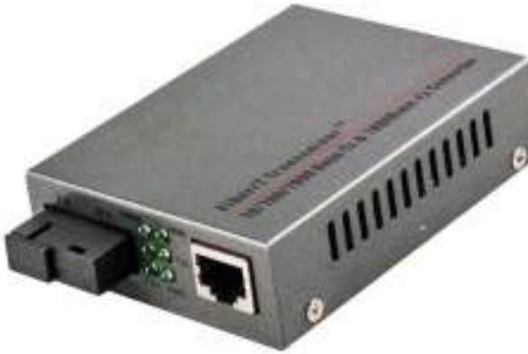
Рис. 1 Внешний вид медиаконвертеров OMC-1000-11S5a (OMC-1000-11S5b)