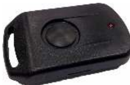
Метка в корпусе.

В отличие от стандартной метки (ActiveTag), данная метка не передает свой код постоянно. Отправка кода метки производится только при нажатии кнопки на корпусе. Метка также снабжена светодиодом, который кратковременно включается только при нажатии кнопки.