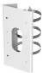
DS-1276ZJ-SUS Крепление на столб