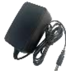
MSA-C1500IC12.0-18P-US MSA-C1500IC12.0-18P-GB MSA-C1500IC12.0-18P-JP Адаптер питания